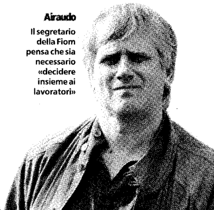
Airaud Il segretario della Fiom pensa che sia necessario «decidere insieme ai lavoratori»